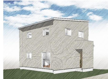
外観はイメージです