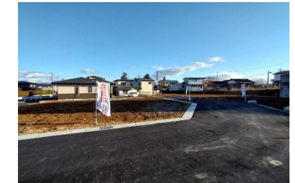
電柱位置 ● 支線位置 ↑