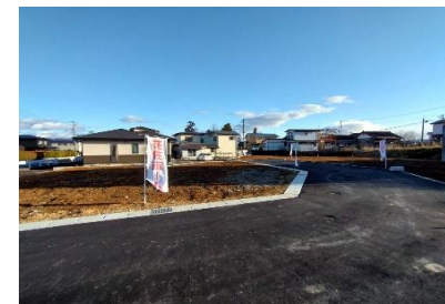
電柱位置 ○ 支線位置 ↑